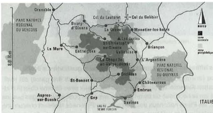
Parc national des Ecrins

- L'évolution du contenu des études terrain illustre assez bien les changements progressifs intervenus dans l'approche du public par ces Parcs nationaux: en 20 ans, on passe d'une approche plutôt « Tour d'Ivoire» à une prise en compte croissante de l'environnement.