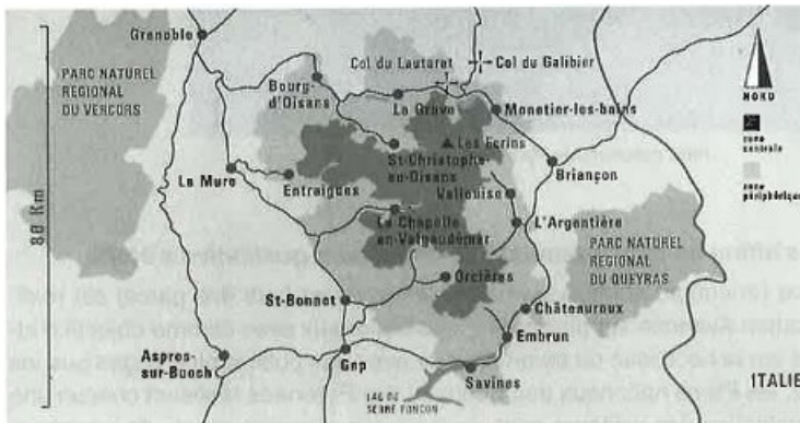
Parc national des Ecrins

- L'évolution du contenu des études terrain illustre assez bien les changements progressifs intervenus dans l'approche du public par ces Parcs nationaux: en 20 ans, on passe d'une approche plutôt « Tour d'Ivoire» à une prise en compte croissante de l'environnement.